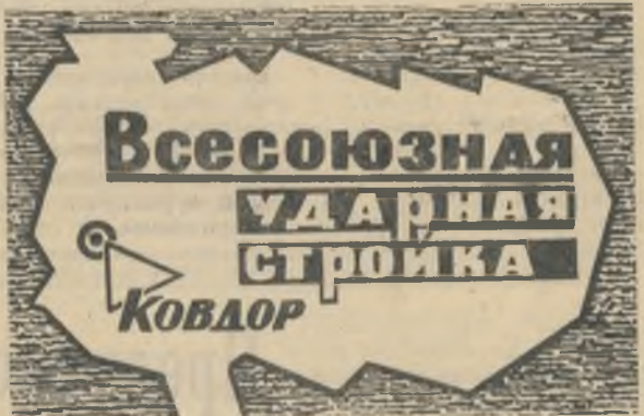
БОЕВОЙ ЛИСТОК «РУДНОГО КОВДОРА»

тель — для распределения материала между четырьмя секциями флотации, расходомеры — на сливе гидроциклонов диаметром 750 мм; установка для усреднения апатитового концентрата. Для нормального протекания технологического процесса требуется повысить температуру мыльного раствора до 50—60 градусов. Для оперативного изучения обогатимости руды различных типов, испытаний реагентных режимов флотации (с целью выдачи рекомендаций для АБОФ) необходимо создать научно-исследовательскую лабораторию. Нужно срочно закончить оборудование нового помещения химлаборатории при АБОФ для выполнения экспресс-анализов. НИУИФ на основании исследований и опытно-промышленных работ во втором квартале текущего года должен выдать рекомендации для использования в промышленности Ковдорского апатитового концентрата с повышенным содержанием окиси магния. Ф. СЫЧУК, главный обогатитель Ковдорского ГОКа.