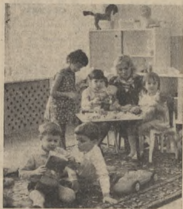
Первых новоселов — 14 малышей — детский сад Ковдорского ГОКа «Журавленок» принял 25 февраля. А сейчас оба этажа нового садика уже наполнились обычным ребячьим гамом.

Елена Сергеевна одной из первых на станции была награждена знаком «Отличник гидрометслужбы», она была депутатом Ковдорского горсовета, участником ВДНХ. Теперь она на заслуженном отдыхе. В. ПОДЫМОВА