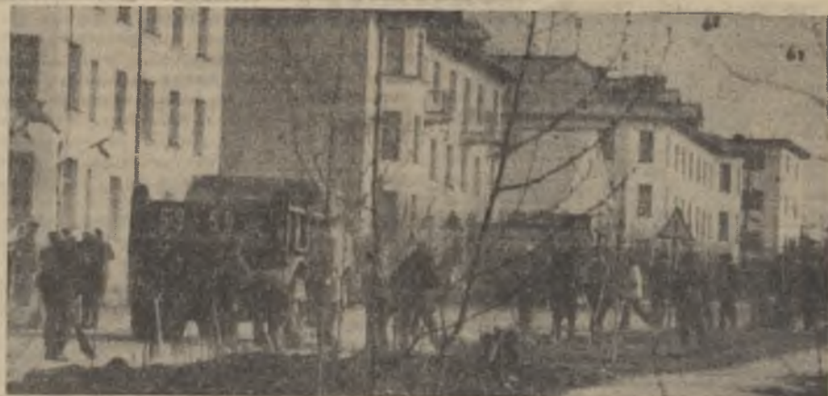
7 мая. Субботник. На снимке — работники обогатительного комплекса Ковдорского ГОКа за уборкой улицы Ленина. Следующий общегородской субботник состоится 28 мая.

Г. ГРАБАН, машинист конвейера участка дробления обогатительного комплекса.