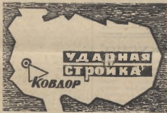
БОЕВОЙ ЛИСТОК «РУДНОГО КОВДОРА»