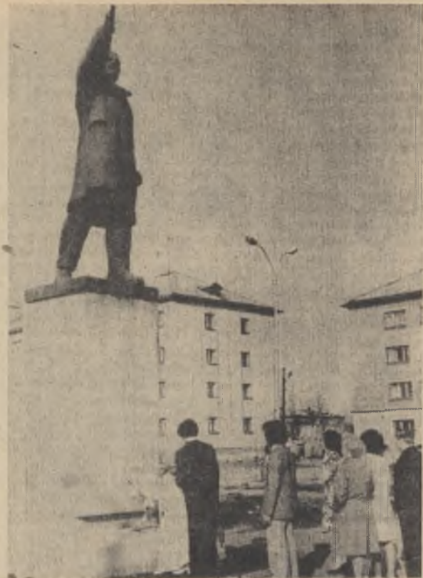
Перед свадьбой.