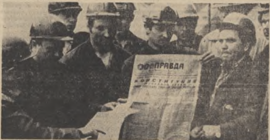
На всех предприятиях, во всех коллективах города идет обсуждение проекта новой Конституции СССР, ковдорчане горячо одобряют решение Пленума ЦК КПСС. На снимке: обсуждение проекта Конституции в коллективе электрослужбы участка дробления.

Коллектив справился с заданием по заготовке и раскряжке деловой древесины. Сверх плана выпущено 76 кубометров ящичной гары, 11 кубометров клепки. 106 кубометров пиломатериалов. В связи с весенней распутицей не выполнен план вывозки древесины и реализации товарной продукции.