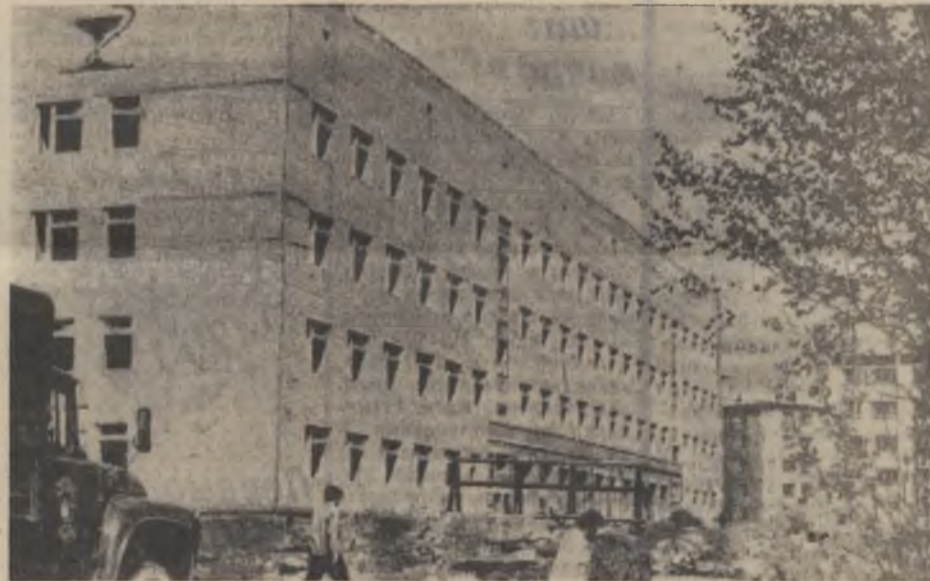
Здание строящейся поликлиники на 600 посещений в день. Коллектив треста «Ковдорстрой» взял в честь 60-летия Великого Октября социалистическое обязательство ввести ее досрочно, к 5 декабря.

М. ФУРСЕНКО, главврач санатория-профилактория профкома Ковдорского ГОКа.