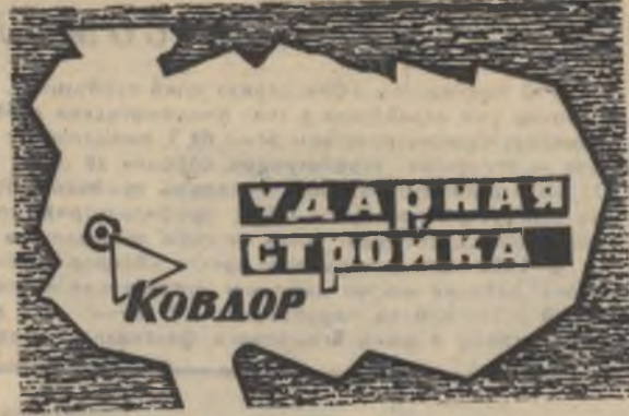
БОЕВОЙ ЛИСТОК «РУДНОГО КОВДОРА»

До сего дня не решен вопрос подведения связи к одному из сдаточных объектов.