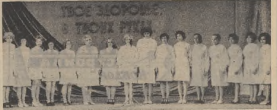
Видите лозунг на заднике сцены? «Твое здоровье — в твоих руках». Верно, но не совсем полно — в немалой степени оно в руках работников санатория-профилактория Ковдорского ГОКа. Таким же дружным ансамблем борются они за здоровье рабочих комбината.

Однако чем достойнее противник, тем выше слава