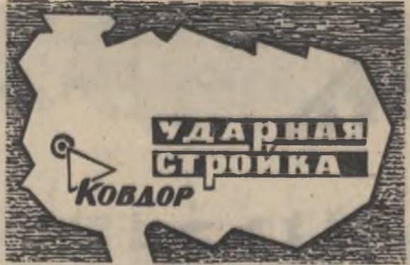
БОЕВОЙ ЛИСТОК «РУДНОГО КОВДОРА» И ШТАБА РАЙОННОГО СТУДЕНЧЕСКОГО СТРОИТЕЛЬНОГО ОТРЯДА «КОВДОРСКИЙ».