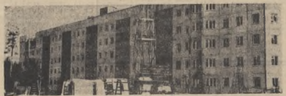
В этом году рабочие и служащие Ковдорского ГОКа получат около 500 новых благоустроенных квартир. На снимке: 16-й дом Ковдорского ГОКа. Одной из новых серий, с улучшенной планировкой. Строители намерены сдать его в четвертом квартале.

Мы приложим все усилия к тому, чтобы студенческие строительные отряды работали именно там, где назначено.