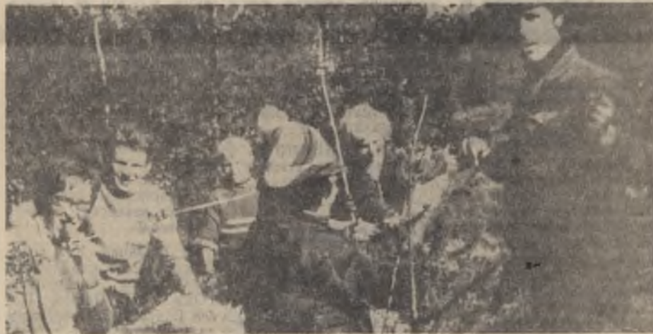
Каждый сезон по-своему привлекателен для отдыха в выходные дни. Начало осени — это лес, грибы и ягоды. Так и отдыхали коллективом работники ОПС в минувшее воскресенье.

А. ТАРАБРИН, заместитель начальника ППЧ-12.