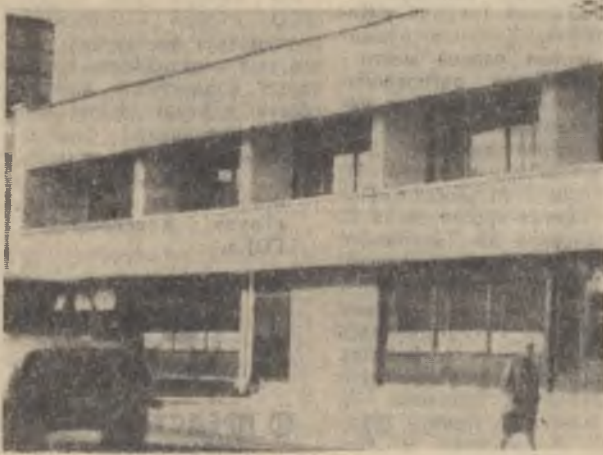
В кулинарном магазине столовой № 1 свои «часы пик». Это время, когда рабочие идут со смены. Очень удобно — прямо по пути домой взять все необходимое для ужина или завтрака. Здесь же можно купить готовые кулинарные изделия для традиционного чая в вечернюю смену.

В. ПАРФЕНОВ, начальник детского спортивного лагеря.