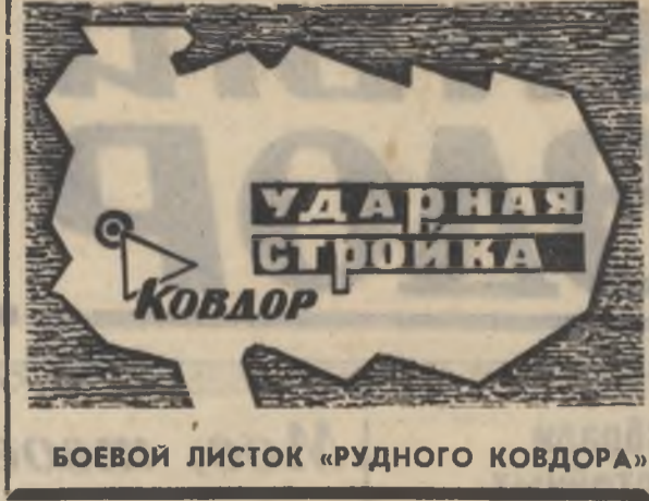
БОЕВОЙ ЛИСТОК «РУДНОГО КОВДОРА»

Перед началом работ во вторую смену я внимательно выслушиваю смених мастеров, начальника участка, бригадиров. Одним нужны драглайн и машина. Значит, будут. Какую-то бригаду необходимо усилить людьми. Усилим. Поступило предложение, что раствор возить не по 2,4, а по 1,6 кубометра.