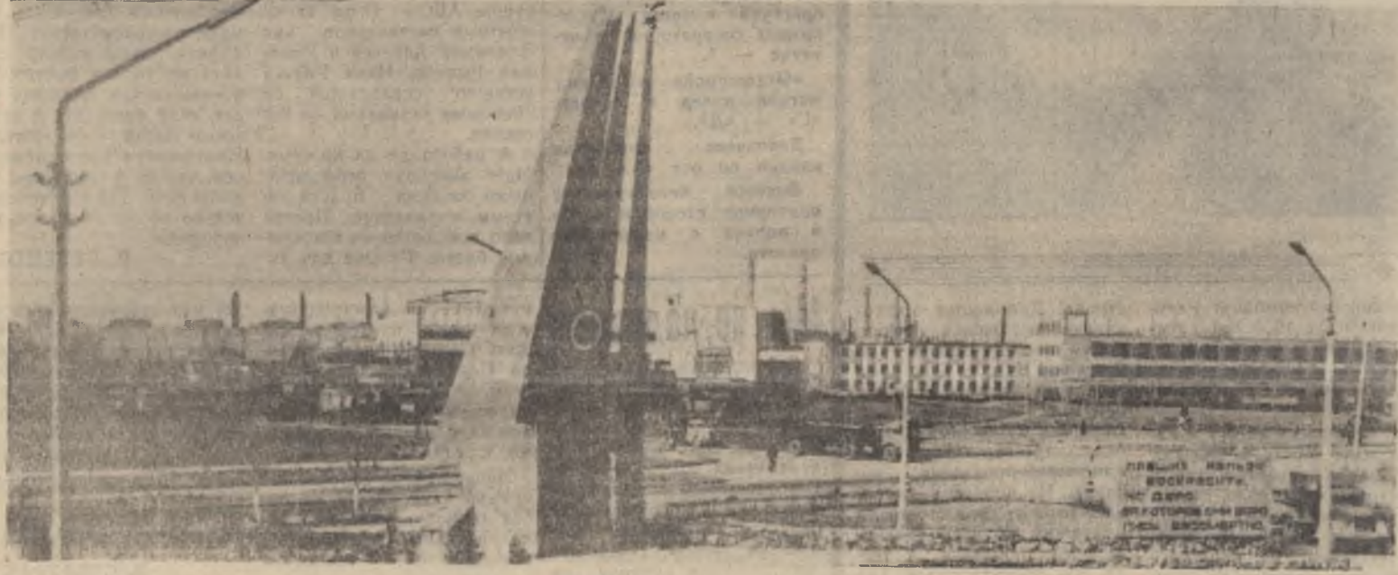
Вид на сталепрокатный и металлургический заводы. На переднем плане — памятник воинам 286-й Краснознаменной стрелковой дивизии, сформированной из вологжан.