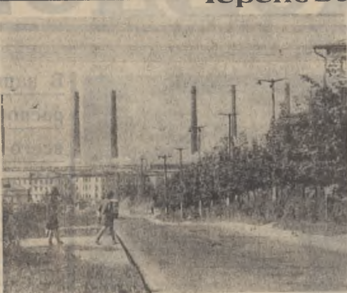
Улица академика И. П. Бардина. На заднем плане — металлургический завод