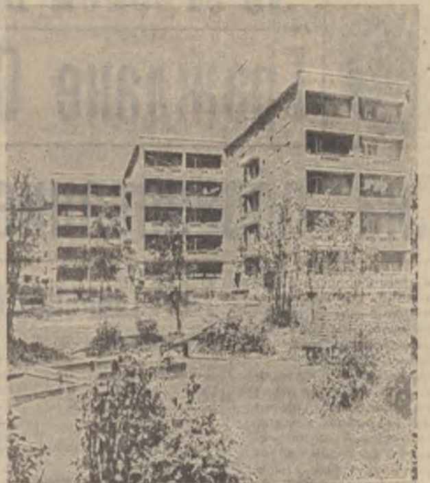
Череповец. Новые жилые кварталы в Заречье.