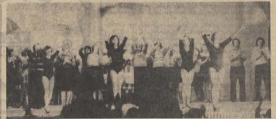
2 ноября, на слете победителей социалистического соревнования Ковдорского ГОКа в честь 60-летия Октября, ковдорчанам впервые будет показана большая праздничная программа, подготовленная участниками художественной самодеятельности всех коллективов Дворца культуры.

В одном только универсаме «Ковдор» за девять месяцев продано телевизоров, радиоприемников, радиол, магнитофонов и других радиотоваров на 283.400 рублей. Кинокамер, фотоаппаратов, кинопроекторов, увеличителей, объективов и прочих фотоваров — на 31.600 рублей. Культоваров — на 29.400 рублей. Музыкальных инструментов, в том числе: пианино, аккордеонов, электромузыкальных, струнных, духовых и ударных инструментов — на 27.000 рублей.