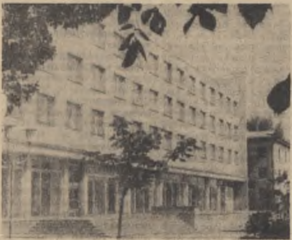
В год великого юбилея в Губкине на центральной улице — Мира — вступила в строй новая гостиница на 100 мест с рестораном. Названа она — «Октябрьской».