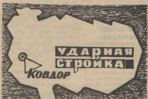
Боевой листок «рудного ковдора»

Коллектив мастера-бригадира В. Стефурака 5 ноября закончил прокладку кабеля оперативных цепей 16 и 17 конвейеров. Установлены шкафы сигнализации маслохозяйства, разведены защитные трубы на датчики температуры и уровня масла. Сейчас предстоит связать оперативными цепями распределительную подстанцию