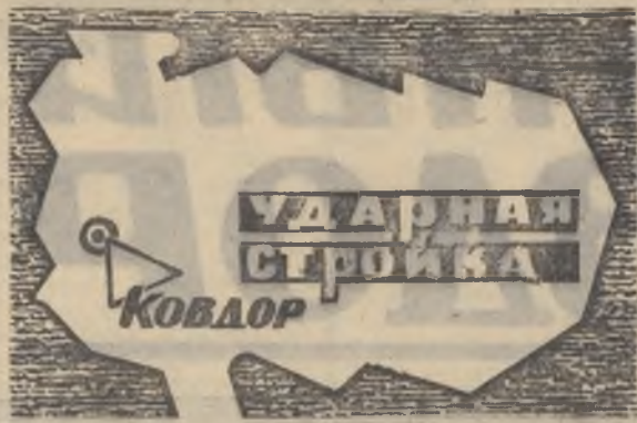
БОЕВОЙ ЛИСТОК «РУДНОГО КОВДОРА»

Сделана бетонная подливка под лапы 34 и 35 конвейера. Поставили изоляцию в трех вентиляционных камерах. Забетонирован башлык подпорной стенки ПС-6. Расширили шахту улиткового питателя шаровой мельницы № 11.