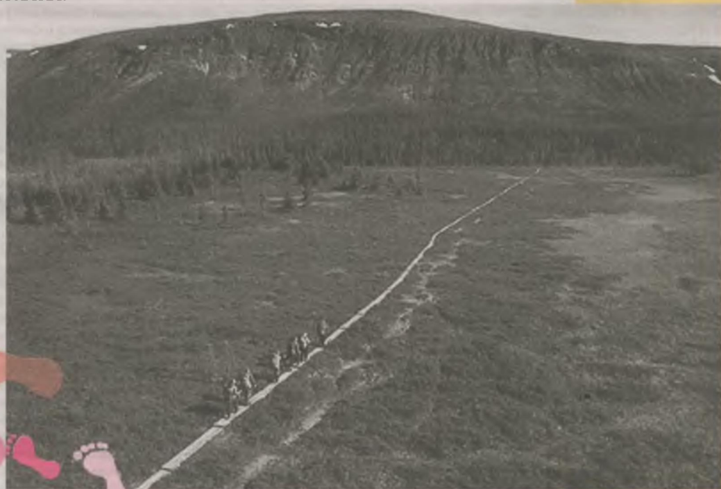
По туристическим маршрутам Ковдорского района.