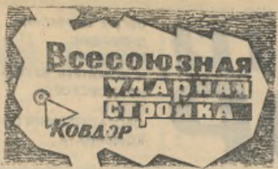
БОЕВОЙ ЛИСТОК «РУДНОГО КОВДОРА»