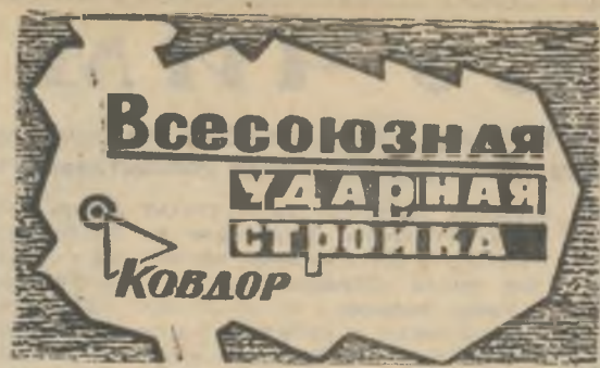
БОЕВОЙ ЛИСТОК «РУДНОГО КОВДОРА»

котлы. За десять дней предстоит уложить 316 кубометров бетона. До конца месяца закончат фундаменты под строительные конструкции на рядах «В» — «Г» и бригада А. Багрия. Таким образом, фундаменты всех котлов и нового корпуса ТЭЦ будут готовы к 1 июня, а полностью с нулевым циклом строительства справятся уже 10-го. В. КРАВЧЕНКО, старший прораб СМУ-2.