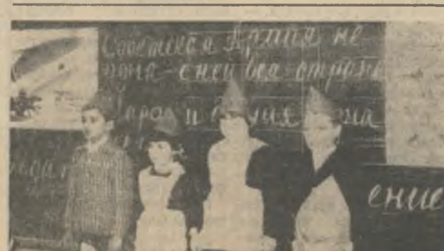
Кто лучше выступит перед шефами? На снимке звездочка «Аврора» из 1 класса «А» школы № 17.