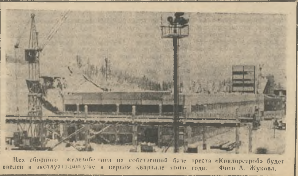
Цех сборного железобетона на собственной базе треста «Ковдорстрой» будет введен в эксплуатацию уже в первом квартале этого года.

Из сказанного следует, что дальнейшее развитие Ковдорско-Ениского промышленного узла целиком зависит от развития производственной базы треста «Ковдорстрой». На каждый миллион рублей роста годовой программы строительного-монтажных работ необходимо вложить в развитие производственной базы 1—1,2 миллиона рублей капитальных вложений. Выде-