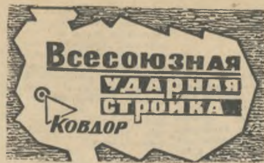
БОЕВОЙ ЛИСТОК «РУДНОГО КОВДОРА»