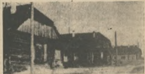
Это и есть тот самый «Старый Ковдор» — дома геологоразведчиков, где разместились первые строители.

зарплатой без охраны, Голубев рисковал, но это был риск вынужденный, в интересах коллектива. Это был так называемый производственный риск, без которого немислима успешная работа. Можно ли обойтись без производственного риска? Не уверен. По инструкциям — легче и проще. Правда, о чем тогда вспоминать в старости? Когда я говорю о производственном риске, я имею в виду то, что называется инициативой в работе, диктуемой обстановкой, а не производственный авантюризм. К сожалению, эти два понятия не всегда разделяются.