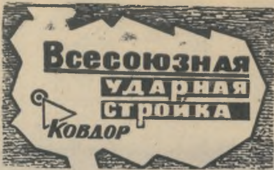
БОЕВОЙ ЛИСТОК «РУДНОГО КОВДОРА»