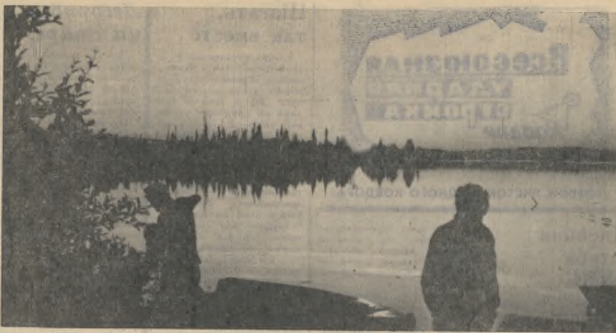
Утро на озере.

С интересной программой, подготовленной агитбригадой, ковдорчане смогут познакомиться завтра, во время торжеств на стадионе. Хорошо бы, чтоб ее увидели как можно больше молодых людей.