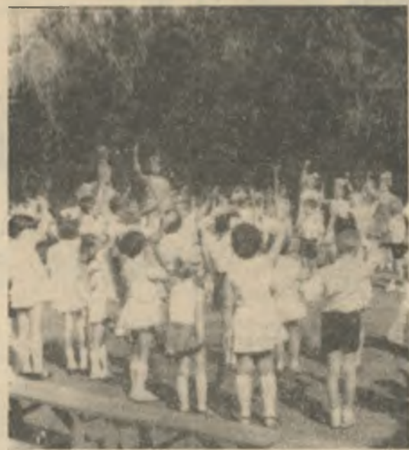
«Здравствуй, лето» — так назвали маленкие ковдорчане из детского сада «Колокольчик» свой первый праздник на даче в поселке Эхар Харьковской области. Все дети здоровы, все веселы, успели загореть и поправиться.