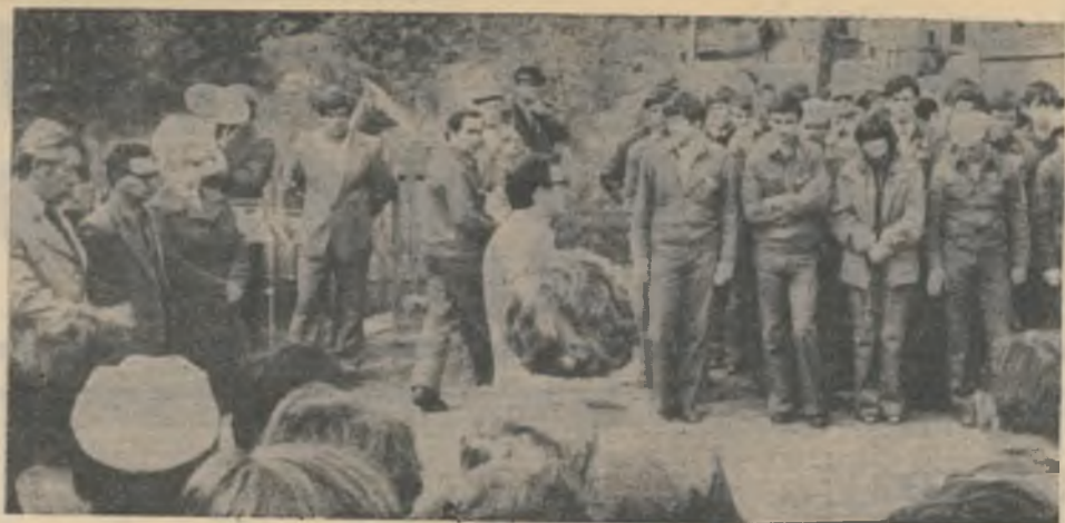
Неделю назад ковдорчане тепло встречали студенческий строительный отряд из Молдавии. А сегодня студентов можно увидеть на 25 строительных объектах — площадках ТЭЦ, 1 секции, подстанции и других. За трудовой семестр бойцы отрядов выполнят объем строительно-монтажных работ, сметная стоимость которых составит 643 тысячи рублей. На снимке: митинг, посвященный приезду студентов-строителей из Молдавии.