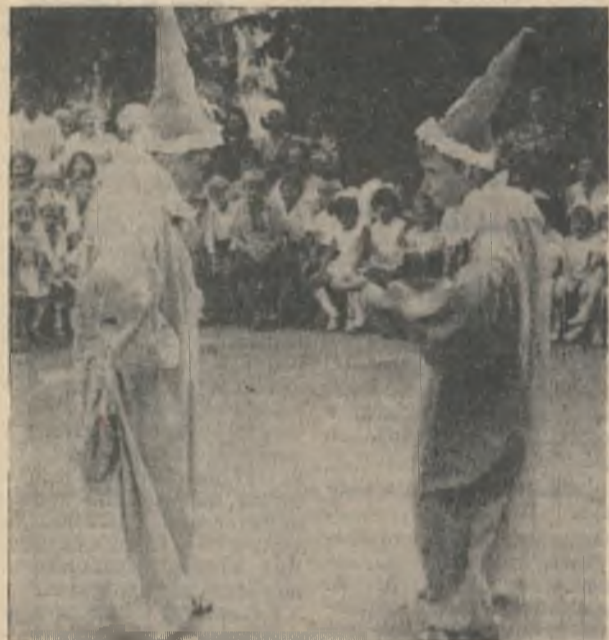
Поселок Эсхар. Забавные Петрушки веселят ребят.

Этот номер газеты в типогра- фии «Кандалякшский комму- нист» набрали лянотиписти Л. Р. ОСЕННИКОВА, Н. П. ВАРНИНА, верстала Н. М. СОЛОВЬЕВА, клише нарезал Л. Д. НАБОТОВ, печатал Р. Я. СОВОЛЕВА, А. И. АНТУ- ШЕВА.