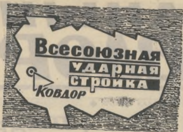
БОЕВОЙ ЛИСТОК «РУДНОГО КОВДОРА»