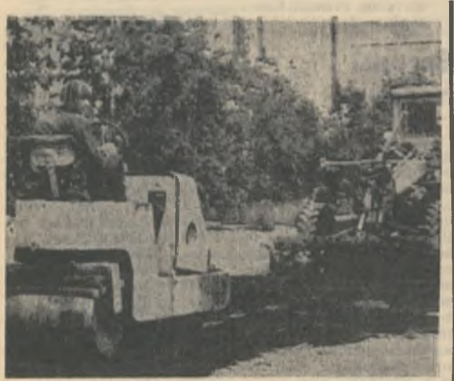
Работники РСУ заканчивают асфальтирование улицы Ленина, — осталось довести до проезда. Близится к концу и благоустройство улицы Кошица, заасфальтированы площадки вокруг горисполкома и профилактория, проезжая часть и тротуары от Зеленой до Строителей.

Но есть опасения, что не все запланированное будет сделано. Ковдорский ГОК исчерпал возможности выделять битум для дорожного строительства, а другие предприятия города не изъявляют желания помочь. И не только битумом, но и транспортом, да и в других вопросах.