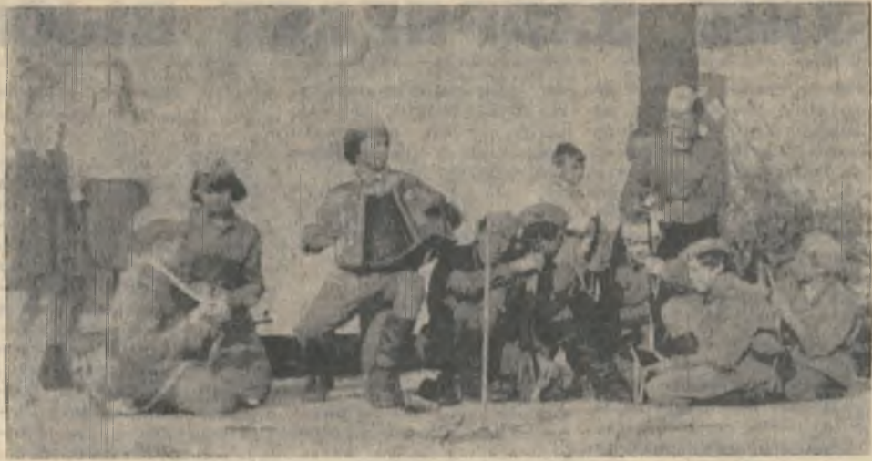
«Бьется в тесной печурке огонь...». Проникновенно звучит песня в исполнении третьего отряда пионерского лагеря «Ковдорец».

Мы узнали, что в Артеке отдыхали в свое время Володя Дубинин, Гуля Королева, Зоя Космодемьянская