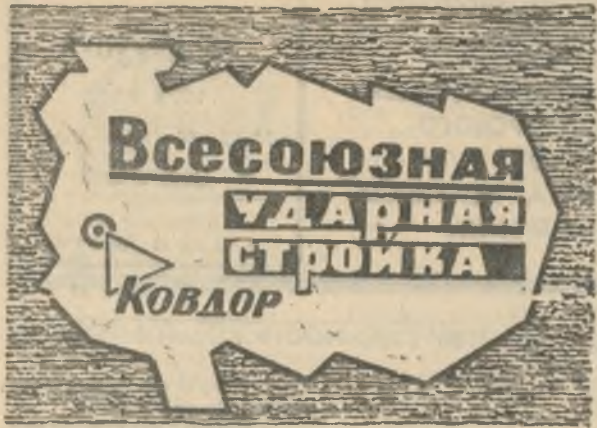
БОЕВОЙ ЛИСТОК «РУДНОГО КОВДОРА»