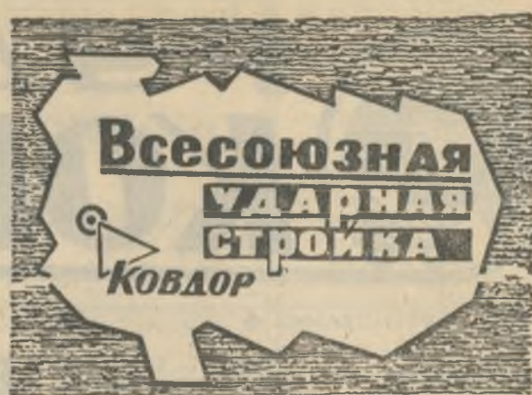
БОЕВОЙ ЛИСТОК «РУДНОГО КОВДОРА»