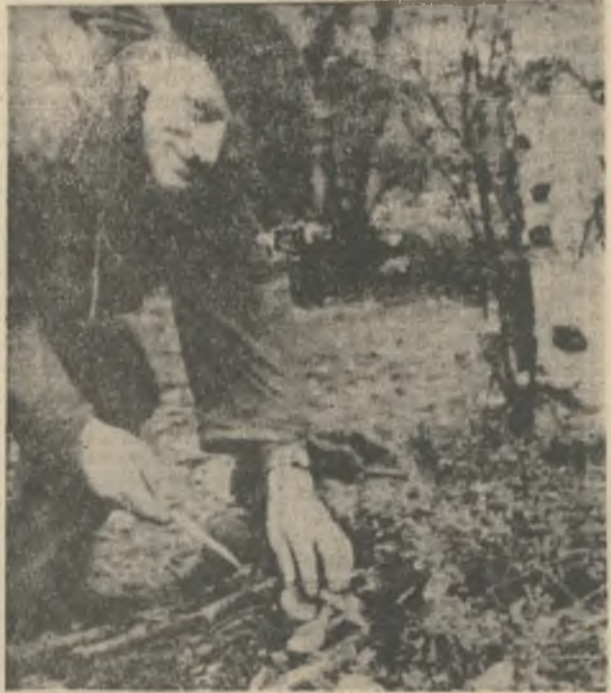
Ловко спрятались под кустик, Но нашлись. Не срезать. — грех! ... Целый год с такой закуской Вспоминать о сентябре.

Через месяц в том же кабинете. — Ну как самочувствие? — Спасибо, доктор. Помогает лечение. — Так-так. Есть, значит, сдвиги... — А как же! Сдвиги ощутили. Отпуск на зиму сдвинули, очередь на квартиру. Проспал несколько раз, на работу опоздал.