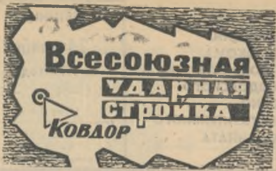
БОЕВОЙ ЛИСТОК «РУДНОГО КОВДОРА»