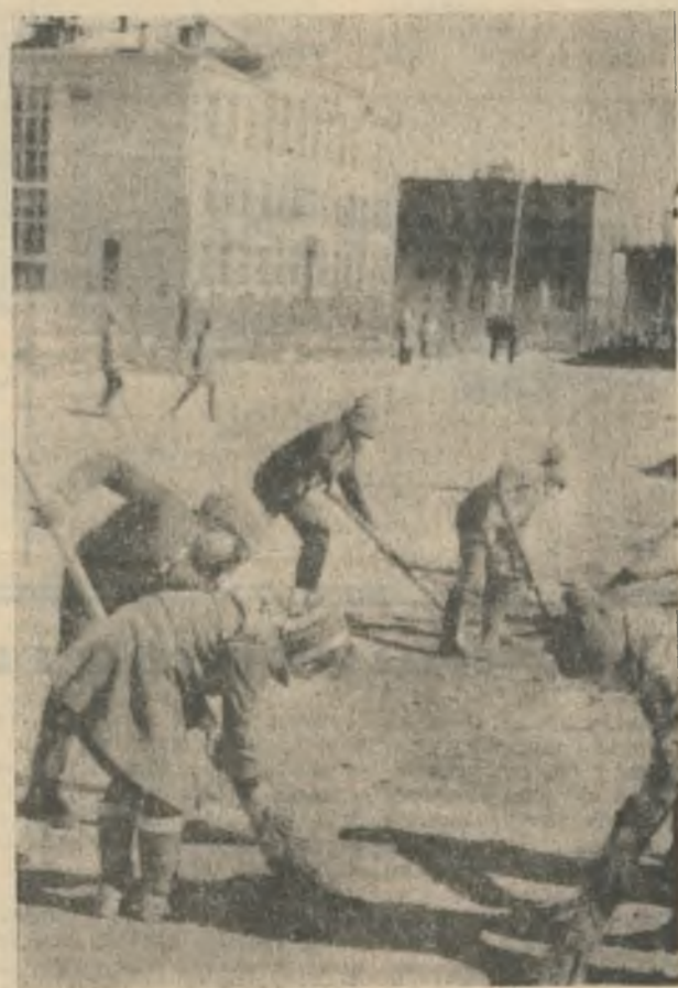
Улица Победы доверена пионерскому отряду имени Зои Космодемьянской из школы № 17. Дружно вышли ребята на первый субботник: расчищали пешеходные дорожки, чистили газоны. И улица сразу преобразилась.

Когда в дружине объявили конкурс «Чей двор лучше?» наш отряд сразу же вышел на субботник. Работали весело. Мальчишки