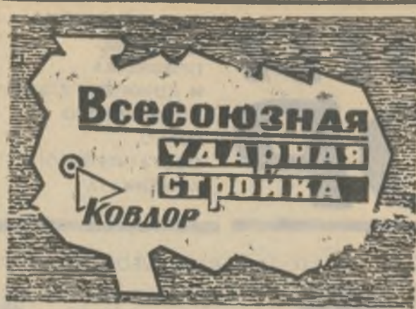
БОЕВОЙ ЛИСТОК «РУДНОГО КОВДОРА»

Сверхплановая реализация продукции равна 868 тысячам рублей. Выполнены и все основные пункты социалистических обязательств.