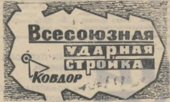
БОЕВОЙ ЛИСТОК «РУДНОГО КОВДОР»

автоматики. 12-го она будет передана под наладку.