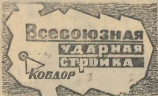
БОЕВОЙ ЛИСТОК «РУДНОГО КОВДОРА»

Рабочий день начинается утренней зарядкой, построением. На линейке мастер рассказывает об объемах, которые предстоит выполнить. Короткая инструкция на рабочем месте — и за работу! Когда хорошо организованно дело, подымается настроение.