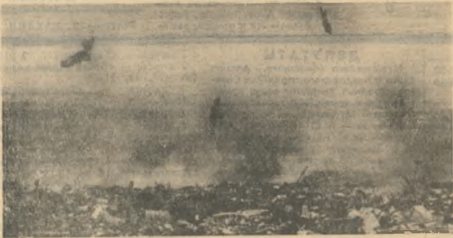
Отъехала мусоровозная машина, и вороны слетаются на пир.

А в соседнем общежитии на улице Кирова комендант В. С. Диомидова лично следит, чтобы хлеб не попадал на помойку. Нашли выход, его собирают отдельно в мешки.