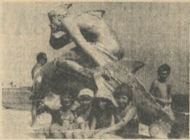
— А мы у сказочного дельфина сфотографировались! пос. Черноморское, лето 1979 года.

Пионерской дружинке лагеря «Ковдор» было предоставлено почетное право участвовать в параде пионерских дружин. Парад был посвящен 35-летию освобождения посёлка Черноморское от немецко-фашистских захватчиков. Пионеры Ковдора возложили венки на братские могилы мёртвых черноморцев.