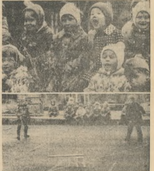
На спортивной площадке детского сада «Солнышко» все как на настоящем стадионе: спортсмены борются за победу, болельщики подбадривают соревнующихся.