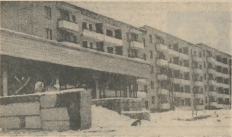
Наша газета уже сообщала, что дом под строительным номером 24 принят с оценкой «хорошо». Сейчас приводится в порядок сантехническое оборудование, в кухнях устанавливаются трехфазные электроплиты. Подрядчик обязался установить их в двадцатых числах октября.