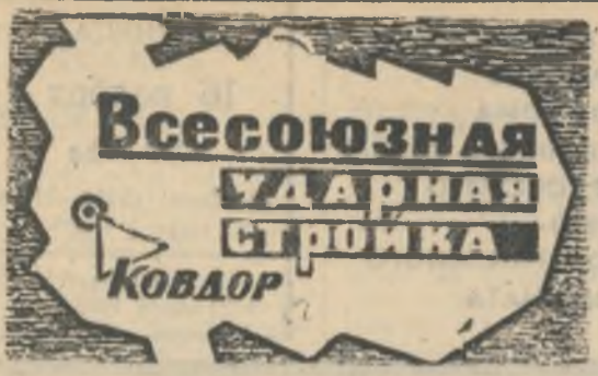
БОЕВОЙ ЛИСТОК «РУДНОГО КОВДОРА»