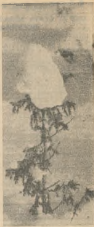
Пусть пока недолг день, Пусть мороз настороже, Но деревья набекрень Шапки сдвинули уже.