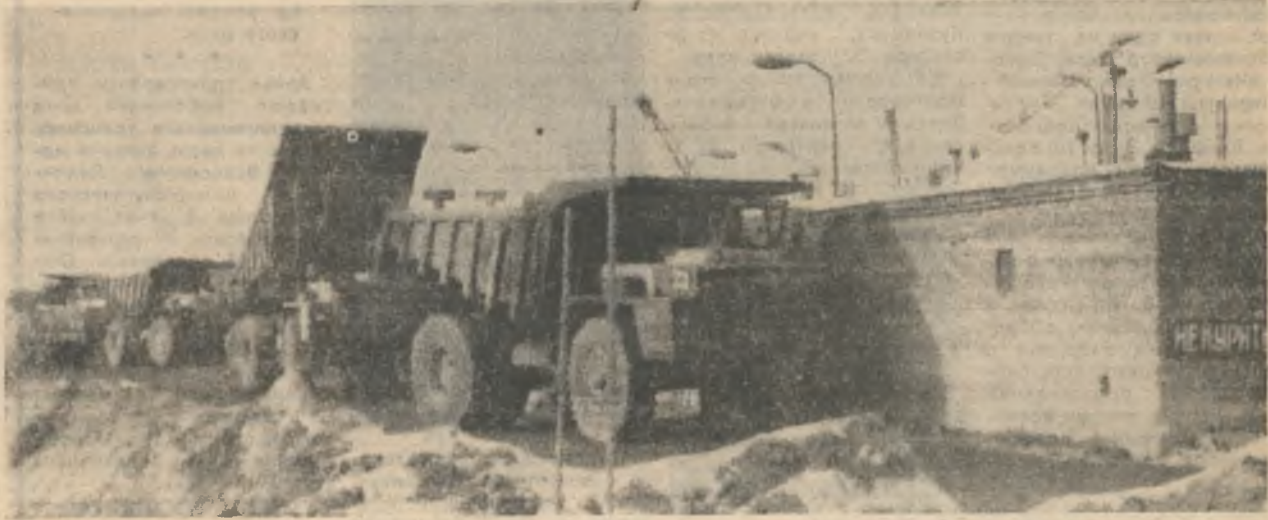
Пробки у старой заправочной станции — явление не такое уж редкое. Два поста явно не успевают снабдить БелАЗы горючим.

В 15 часов у автозаправочной станции цеха технологического транспорта тесно. Урчит очередь мощных самосвалов. Все спешат. Всем надо. Скоро пересменка. Водители, конеч-