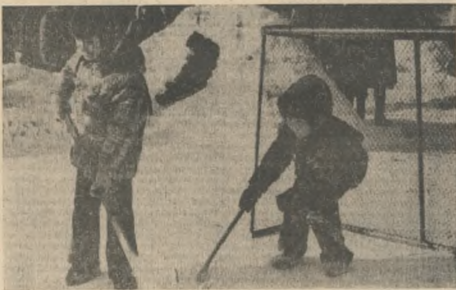
Хоккеисты (снимок сделан на спортплощадке яслей-сада «Чайка»). Фотоэтиюд В. Иоакимиди.

Фото В. ЦЕЛОВАЛЬНИКОВА , слесаря пылевентилиционной службы обогатительного комплекса.