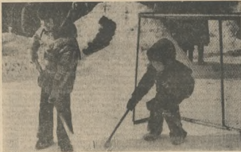
Хоккеисты (снимок сделан на спортплощадке яслей-сада «Чайка»).

В программе соревнований первого дня: дистанция 10 километров для мужчин, 5 километров для мужчин старшего возраста, у женщин соответственно 5 и 3 километра (для первой и второй групп дистанция в личном первенстве общес.). У школьников: 10 километров для юношей и 5 кило-