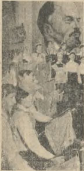
Участников конференции приветствуют юные пионеры.

Хочу остановиться на одном из направлений наших работ в предстоящей пятилетке. Крупные ресурсы карбонатитов и специфичный состав этого сырья заставляет вновь возвращаться к поискам и проработке путей его промышленного использования. В настоящее время в Северо-Западном экономическом районе — два алюминиевых завода: Канда拉克ский и Надвоицкий. Они используют глинозем Пикалевского завода под Ленинградом, который производит его из нашего колчакского нефелина. И все потому, что ближе Пикалево до настоящего времени не имелось известкового флюса. Теперь же обозначились иные варианты, поскольку найдена технология получения флюсовой извести из карбонатитов Ковдора.