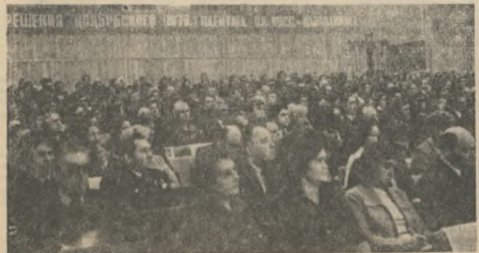
Транспарант в зале заседания «Решения ноябрьского (1979 г.) Пленума ЦК КПСС — выполним!» как бы подытоживал каждое выступление делегатов.

Коллективу Ковдорского ГОКа, на наш взгляд, пора уже ставить перед собой задачу превратить предприятие из планово-убыточного в прибыльное. То есть, в полном объеме освоить проектные производствен-