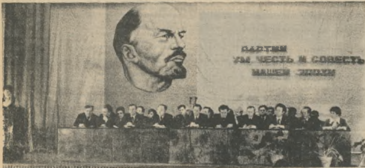
Президиум 1-й Ковдорской партийной конференции.

ПЯТНИЦА, 11 января 1980 года № 3-4 (1181-1182) Цена 2 коп. Газета издается с 21 июля 1962 года