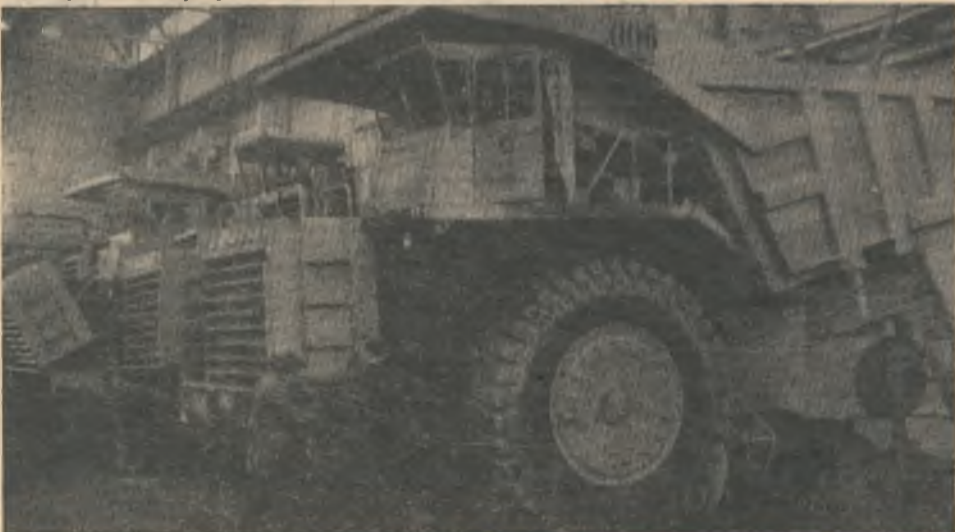
Третий корпус — база отделения БелАЗ-549