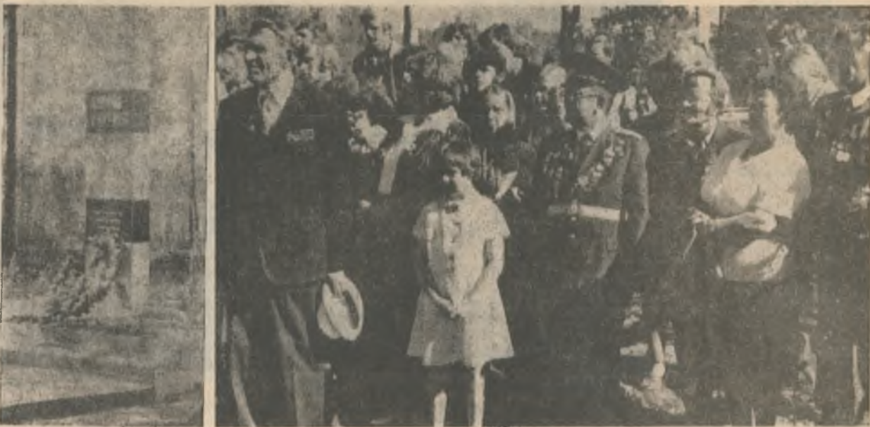
В торжественном молчании застыли бывшие партизаны и представители общественности района на митинге, посвященном открытию монумента в Шуми-городке.