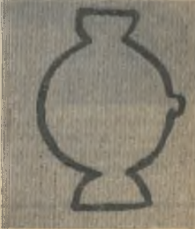
Рис. № 2 (ответы см. на 4-й стр.)