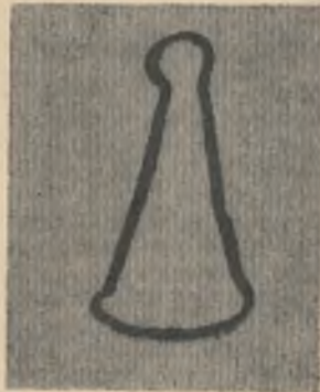
Рис. № 3