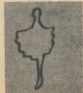
Рис. № 4 (ответы см. на 4-й стр.)