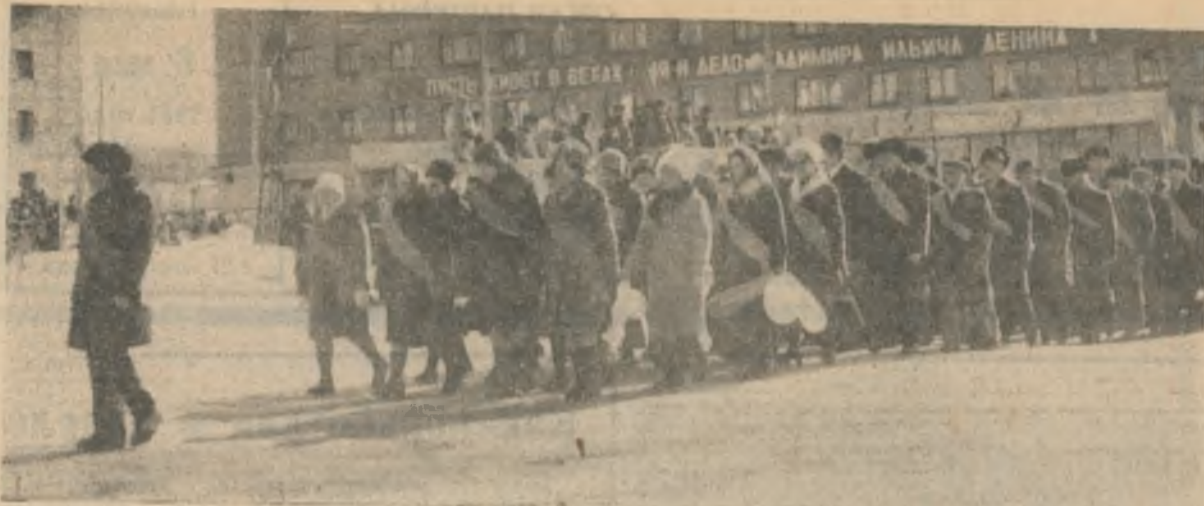
Первомайскую демонстрацию в Ковдоре открыла колонна ветеранов Великой Отечественной войны.