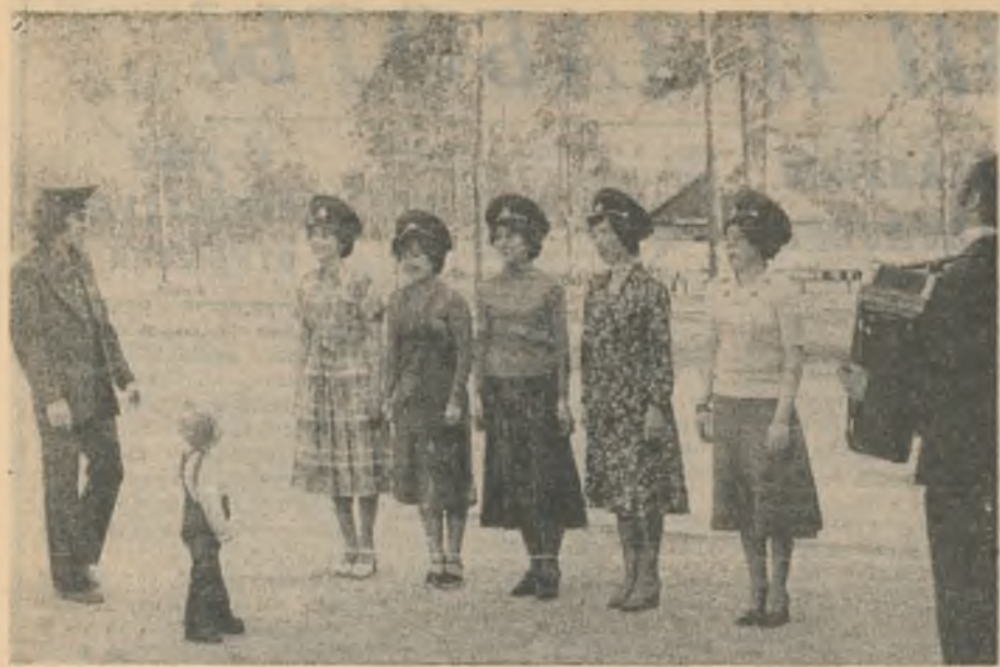
Накануне Дня пограничника агитбригада жилищно-коммунального управления выехала с шефским концертом к воинам. Они тепло принимали каждый номер в исполнении самодеятельных артистов. Песни сменялись стихами, стихи — танцами. А для шуточной сценки под названием «У солдата выходной» шефы попросили у хозяев зеленые фуражки, чтобы «все как по правде было».