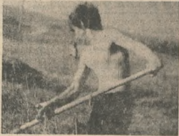
Покосы на месте бывшего отвала рудника «Железный» (фото 1980 года).