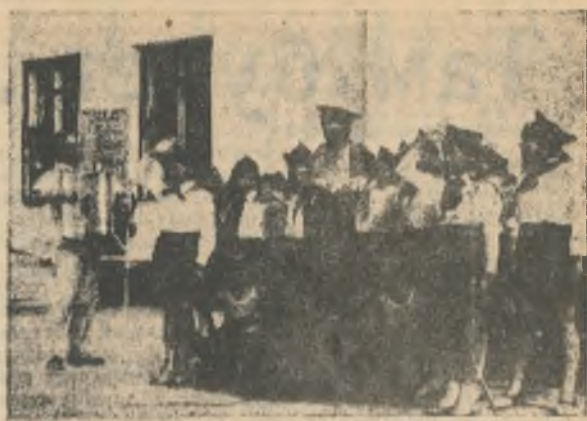
Пионеры четвертого отряда исполняют песню «Заветный камень».

Кроме того, девочки продемонстрировали модели сезона, а также современные прически, за которые юные