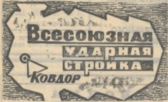
БОЕВОЙ ЛИСТОК «РУДНОГО КОВДОРА»

Коллектив комбината поддержал пожелания строителей о досрочной сдаче в эксплуатацию мощностей по добыче одного миллиона тонн руды и выпуску 440 тысяч тонн апатитового концентрата. На снимке — корпуса АБОФ.