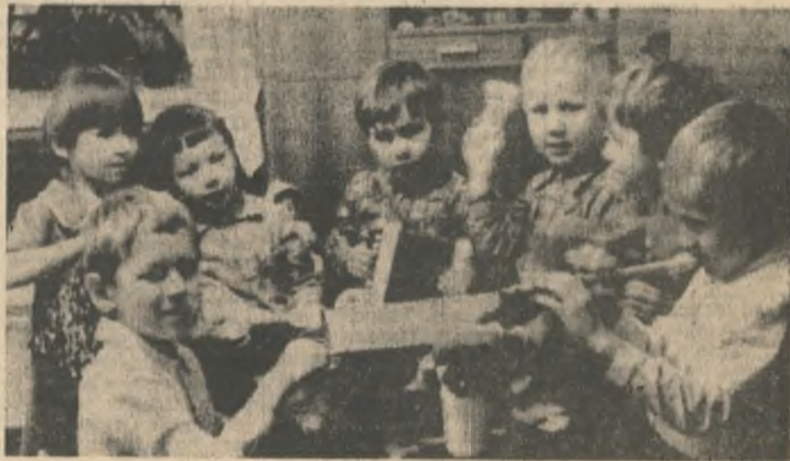
Инструментальный ансамбль яслей-сада «Аленушка» (ЖКУ Ковдорского ГОКа).

По материалам газеты «Октябрьская магистраль».