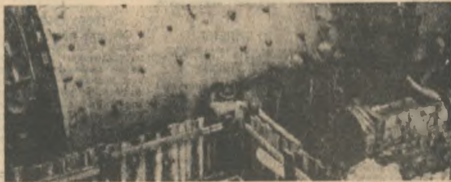
На текущий ремонт остановлена пятая секция. Бригада слесарей-ремонтников оттягивает броню барабана стержневой мельницы. Это та самая — пятая секция, что последней из реконструированных вступила в строй. А на переднем плане вы видите: ограждены фундаменты шестой секции, которую готовят к реконструкции.

В. ЕФИМОВ, мастер первого механо-монтажного участка.