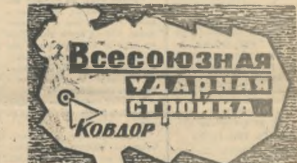
БОЕВОЙ ЛИСТОК «РУДНОГО КОВДОРА»