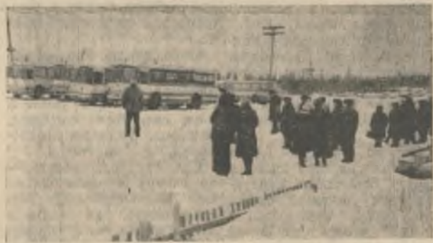
16 марта, 13 часов 40 минут. Конечная остановка автобусов на Слюдяной. Нужны ли комментарии?

Все правильно. Это не единовременная кампания, а целенаправленная и целеустремленная работа. И чем настойчивее мы будем ее проводить, тем меньше будем терять и рабочее время, и тонны концентратов — нашей конечной продукции.